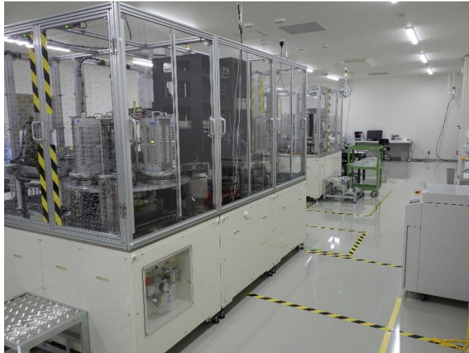
ファラデーローテータの光学特性を検査するグラノプト第2工場内の装置

グラノプトは今後も、光通信を支える高品質な製品の安定供給を通じて、高度情報通信社会の実現に貢献してまいります。